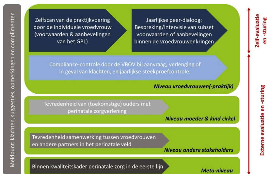
Afbeelding 1: (zelf-)evaluatie van de perinatale zorgverlening volgens GPL (Check-fase)

In het verleden stelde het kwaliteitskader de VBOV vzw niet in staat om na te gaan of de GPL-houders ook effectief de voorwaarden en aanbevelingen naleefden. Het nodigde vroedvrouwen onvoldoende uit om regelmatig te reflecteren, leren en te verbeteren rond de good-practice aanbevelingen. VBOV vzw wil ook in de toekomst geen heksenjacht uitvoeren, maar vroedvrouwen helpen om de nodige kennis en competenties te verwerven om kwalitatieve perinatale zorg aan te bieden en inzicht in eigen handelen en in de werking van vroedvrouwen(praktijken) te stimuleren. Het nieuwe kwaliteitskader is dan ook sterker gericht op (zelf-) evaluatie van de perinatale zorgverlening (zie ook figuur 1 hieronder).