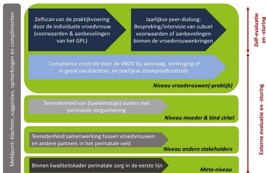
Afbeelding 1: (zelf-)evaluatie van de perinatale zorgverlening volgens GPL (Check-fase)

In het verleden stelde het kwaliteitskader de VBOV vzw niet in staat om na te gaan of de GPL-houders ook effectief de voorwaarden en aanbevelingen naleefden. Het nodigde vroedvrouwen onvoldoende uit om regelmatig te reflecteren, leren en te verbeteren rond de good-practice aanbevelingen. VBOV vzw wil ook in de toekomst geen heksenjacht uitvoeren, maar vroedvrouwen helpen om de nodige kennis en competenties te verwerven om kwalitatieve perinatale zorg aan te bieden en inzicht in eigen handelen en in de werking van vroedvrouwen(praktijken) te stimuleren. Het nieuwe kwaliteitskader is dan ook sterker gericht op (zelf-) evaluatie van de perinatale zorgverlening (zie ook figuur 1 hieronder).